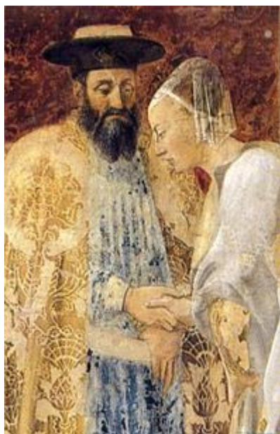
[Imm: Salomone e la regina di Saba (partic) – Piero della Francesca -1465 Chiesa di San Francesco Arezzo]

Salomone è una figura importante; studiamo bene il suo comportamento perché ci insegnerà moltissimo sul nostro presente e sul futuro.